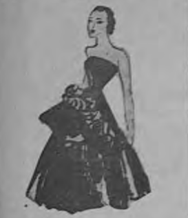
Vestido de seda negra con collar, nada de cosas (Craçion Gros).