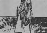
UNA ROSA QUE CRECE DE UNA ROSA