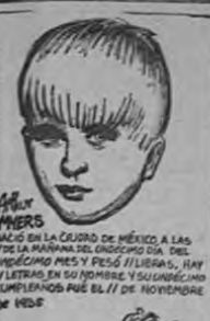
UNA ROSA QUE CRECE DE UNA ROSA