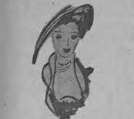
Sombrero de paja negra con pluma castaña (Craçion Rosa Valle).