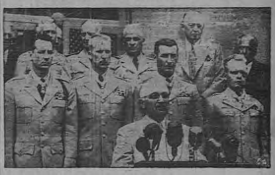
Luchando sus condecoraciones. La Medalla de Honor, un grupo de oficiales que se hicieron acreedores a la condecoración...