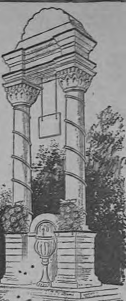
UN MONUMENTO A NADIE