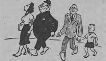
HUELGA DE PIES DESCALZOS. La Comisión Investigadora de la Carretera comenzó a echarle mano a uno de los problemas más serios...