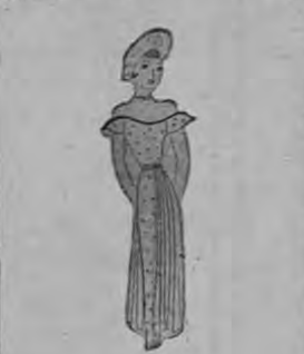
Vestido de peral blanco con punos rojos y sobrepasa frunida de peral verde vivo (Craçion Henry a la Penne).