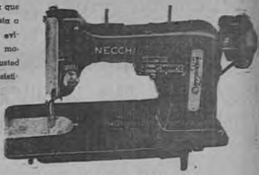
Garantizada por toda la vida

ESA eficiencia, finísima que encanta y que conquista a la mujer hacendosa, es evidente en estos preciosos modelos. Pase a verlos y usted también sentirá una irresistible seducción.